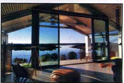
AS ÁGUAS – A albufeira é o cenário para esta casa com um estilo arquitectónico único

Preço por noite: Entre 90 e os 150 euros Localização: Herdade da Rocha, Santa Eulália - Elvas Contacto: 917 214 380 Site: