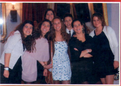
ÉVORA antigo Clube volta a animar