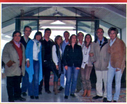
ROMARIA na Ermida de Santa Catarina