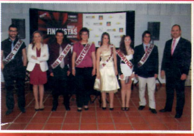
Baile de Finalistas da Epral